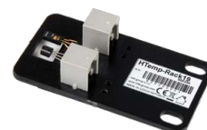
HTemp-1Wire Rack 19